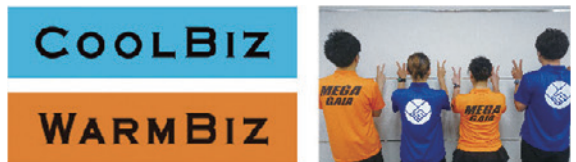
従業員啓発用ポスター(抜粋)

クールビズ期間中、エアコンの設定温度は28度を目安とし、社員・アルバイトスタッフとともに軽装で勤務しています。ウォームビズ期間中は、加湿器やサーキュレーターによる空気循環などを行い暖房に頼りすぎず、冬を暖かく快適に勤務する工夫を行っています。